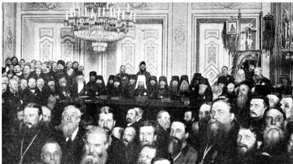
Торжественное открытие I-го Всероссийского Съезда единоверцев (г. Санкт-Петербург, 22-30 января 1912 г.)