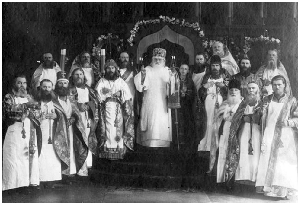
Мироварение (Москва, 1924 г.)