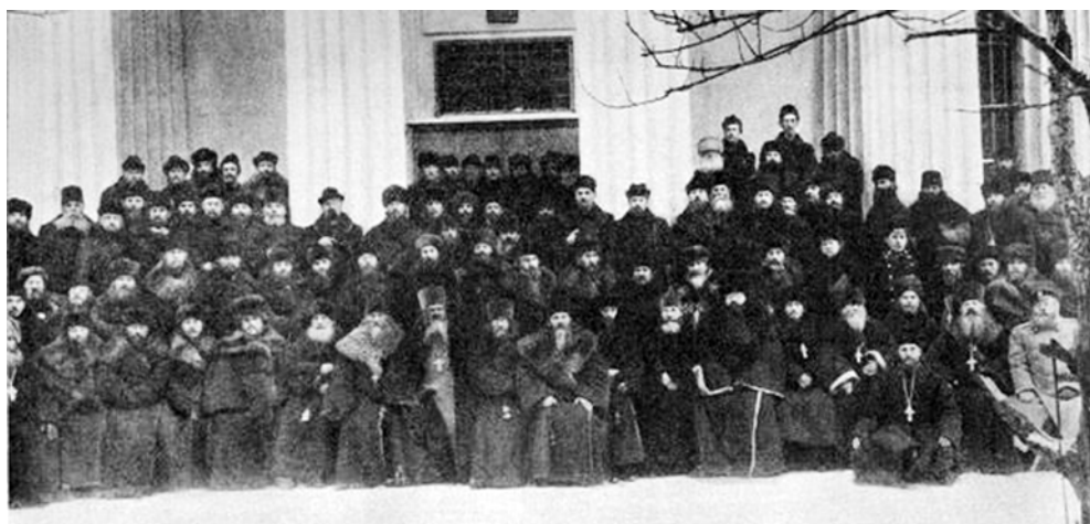
Делегаты I-го Всероссийского Съезда единоверцев (г. Санкт-Петербург, 22-30 января 1912 г.)