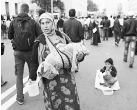
Российские власти собираются улучшить имидж цыган // КоммерсантЪ-Власть. – 2009. – 24 августа. – № 33

ются условия их существования, образ жизни и материальный достаток. Формирование стереотипов об этнической группе цыган складывается под воздействием двух групп характеристик. Одна из них связана с девиантным поведением цыган – дромоманией (склонностью к бродяжничеству) и клептоманией (склонностью к воровству), которые требуют выработки форм социализации цыганского населения.