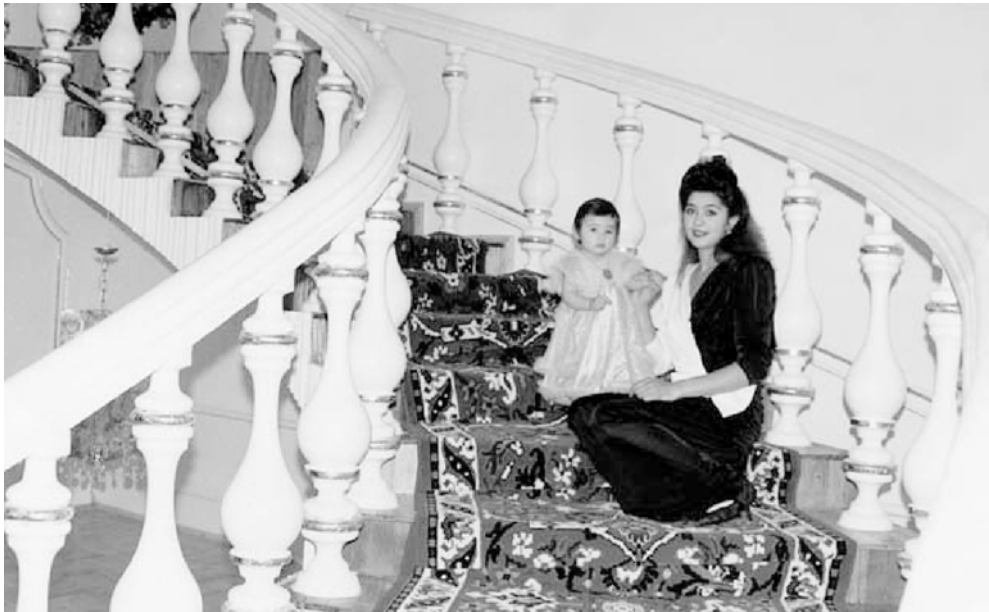
Интерьер цыганского дома в Самаре. 1990-е годы.

Другие характеристики используются в отношении цыган перешагнувших черту бедности и черту среднего достатка, занявших привилегированное положение в стратификационной пирамиде: