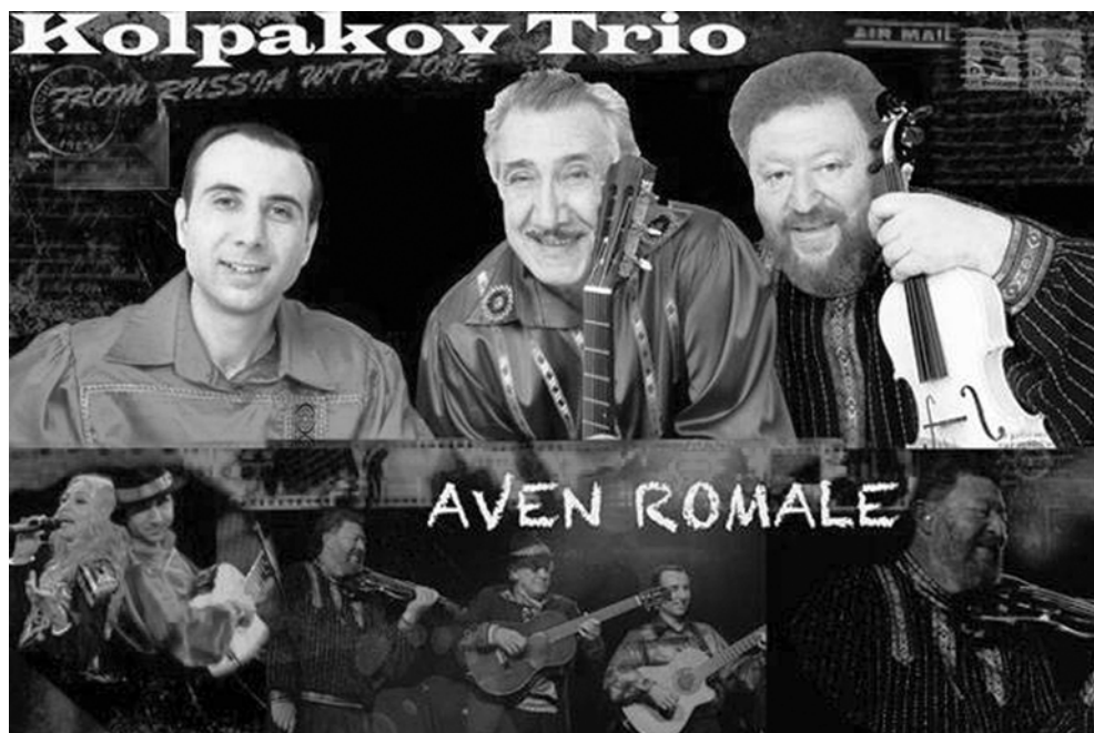
Афиша «Колпаков Трио»

А. Колпаков не только является одним из лучших гитаристов-семиструнников России, но и широко известен как певец и композитор. Он автор целого ряда инструментальных пьес и обработок для семиструнной гитары